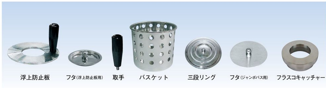
浮上防止板 フタ(浮上防止板用) 取手 バスケット 三段リング フタ(ジャンボバス用) フラスコキャッチャー