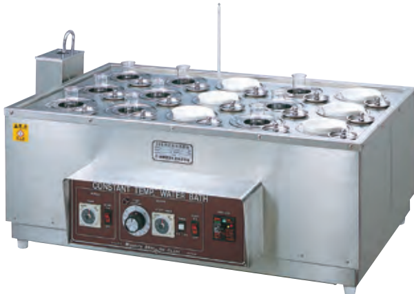
WL-15(電気) (タイマー2個付き)