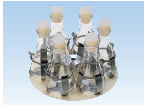
三角フラスコホルダー