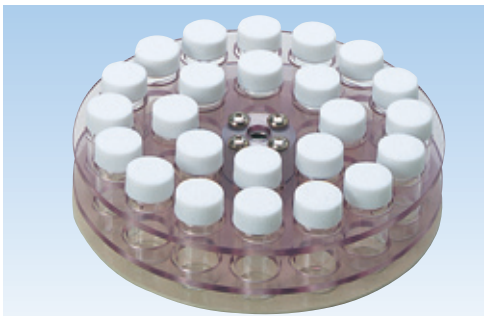
バイアル瓶ホルダー