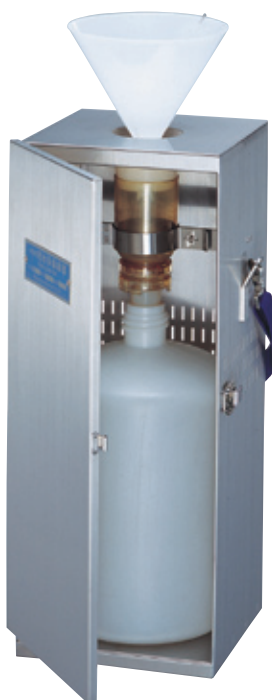
RS-18-B (手提げ型ボックス付)