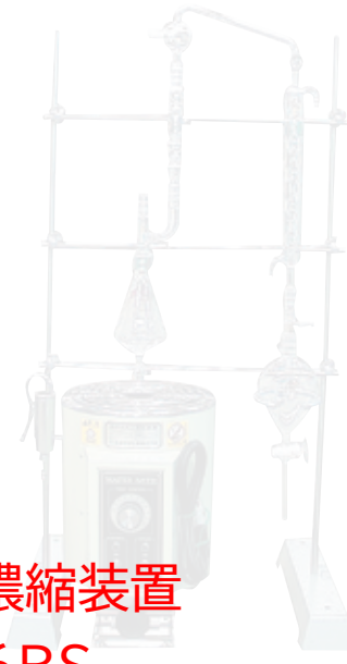
KD-1W (ユニットスタンド付き)

・KD(クデルナ・ダニッシュ)濃縮装置 KD-1W, KD-3W, KD-6BS ・丸型電気定温湯煎器 WR-2, -3, -4, -5