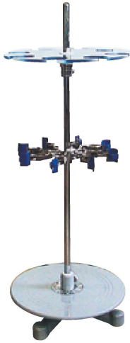
ダイオキシン用カラムホルダー